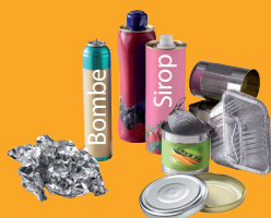
Emballages métalliques (+ bouchons)